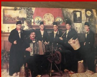
Grupo Los Casiques